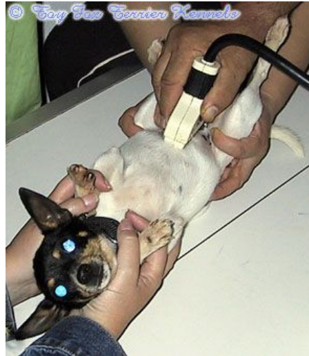
A.P. tiineysultrassa 23.7.2004.

Kennelimme pienin aikuinen koira, tri-color narttukoira 'PR' Dunkel's Mignetin A.Pirkkalainen astutettiin tulevalle isällä eli kennelimme Micro Pawlla 14.6, 16.6 ja 19.6.2004. Pennut tulevat olemaan väritykseltään tri-color. Emä ja isä sekä heidän emät ja isät ovat 100 % terveitä, tarkastettuja ja käytössä erinomaisiksi todettuja käyttökoiria. Molemmat vanhemmat ovat kooltaan suhteellisen pieniä, joten